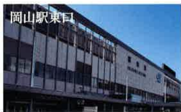
移動がラクラクの駅近。