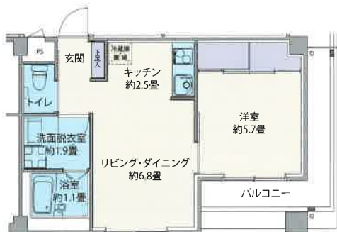
掲載の環境写真は平成27年8月・10月に撮影したものです。掲載の間取図は設計図を基に描き起こしたもので、行政官庁の指導により変更となる場合がございます。