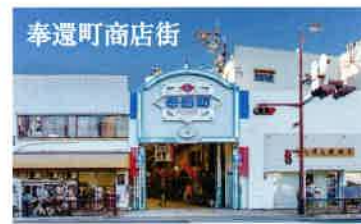
地域とふれあえる喜び。