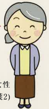
Fさま 78歳 女性 (要介護2)

食事は厨房で作っているので、温かい食事でおいしいです。味付けもちょうどいい加減で口に合うので、よかったです。音楽の時間やみんなでのお出かけしたりとイベントも楽しんで参加しています。