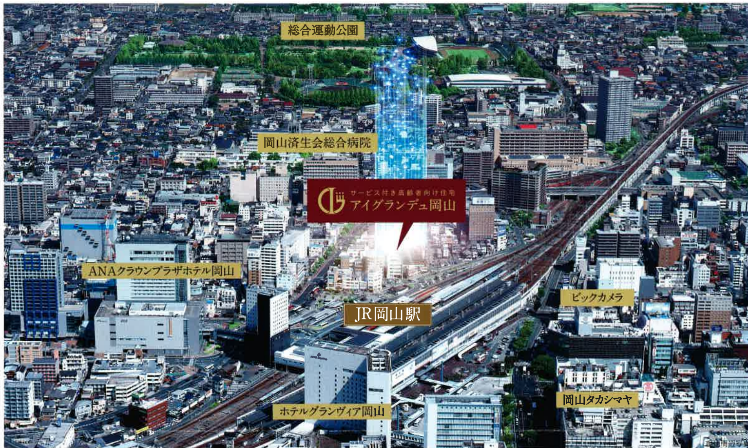
掲載の空撮写真は平成27年9月に撮影したものに一部CG処理を施しております。