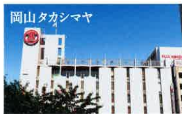
お買い物や生活に便利。